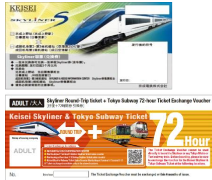
写真左：京成スカイライナー、写真右上：スカイライナークーポン(引換券)イメージ 写真右下：Keisei Skyliner & Tokyo Subway Ticket(引換券)イメージ