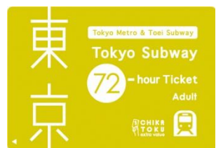
Tokyo Subway Ticket(イメージ) 左から24時間・48時間・72時間(いずれも大人用)