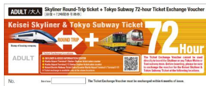
写真左：京成スカイライナー、写真右上：スカイライナークーポン（引換券）イメージ 写真右下：Keisei Skyliner & Tokyo Subway Ticket（引換券）イメージ