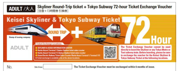
写真左：スカイライナー、写真右：Keisei Skyliner & Tokyo Subway Ticket(引換券)イメージ