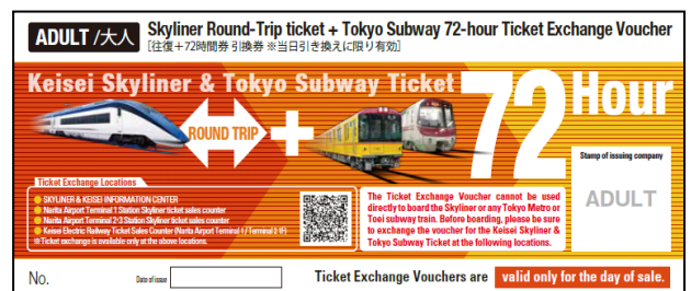
写真左：スカイライナー、写真右：Keisei Skyliner & Tokyo Subway Ticket（引換券）イメージ