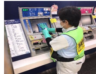
駅構内の消毒作業