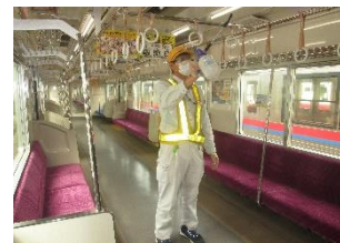
車内の消毒作業 (一般車両)

お客様におかれましても、手洗い・うがい・咳エチケットのほか、時差出勤など混雑時間帯を避けたご乗車や、車内換気のため天候や混雑状況に応じた窓上部の開閉等へのご協力、また、可能な限り、マスクの着用と会話の際の周囲へのご配慮をお願い申し上げます。