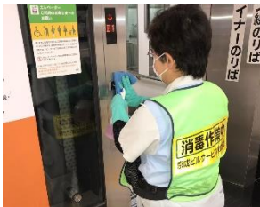
エレベータの消毒作業

※職員の熱中症予防のため、お客様と近接しない事を確認したうえでマスクを着用しない場合がございます。