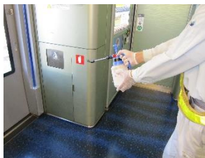
車内の消毒作業 (スカイライナー)