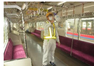
車内の消毒作業 (一般車両)

お客様におかれましても、手洗い・うがい・咳エチケットのほか、時差出勤など混雑時間帯を避けたご乗車や、車内換気のため天候や混雑状況に応じた窓上部の開閉等へのご協力、また、可能な限り、マスクの着用と会話の際の周囲へのご配慮をお願い申し上げます。