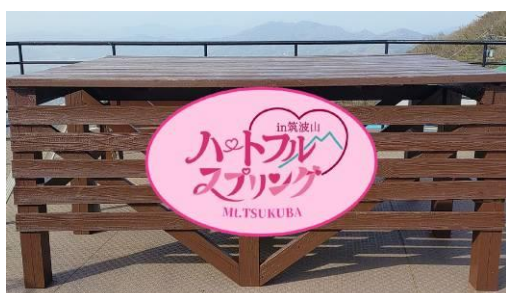
コマ展望台フオトスポット (イメージ)