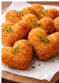
ハートのコロッケ(イメージ)