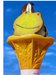
筑波山ケロケロソフト