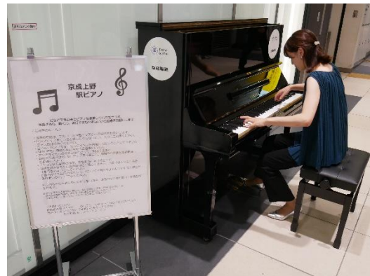
京成上野駅ピアノ設置 ミニコンサートの様子