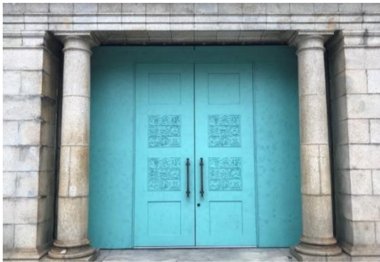
旧博物館動物園駅出入口扉 (東京藝大美術学部長(2018年当時)・日比野克彦氏デザイン)

これまで、東京都選定歴史的建造物である「旧博物館動物園駅」の駅舎改修における出入口扉のデザイン(2018年)、京成上野駅のリニューアルに際しての発車メロディーの作成(2019年)、京成上野駅地下連絡通路のリニューアル(2020年)、京成上野駅への駅ピアノ設置(2022年)、旧博物館動物園駅をデジタルアーカイブした「デジタルハグドウ駅」の公開(2022年)など、各分野での連携を進めています。