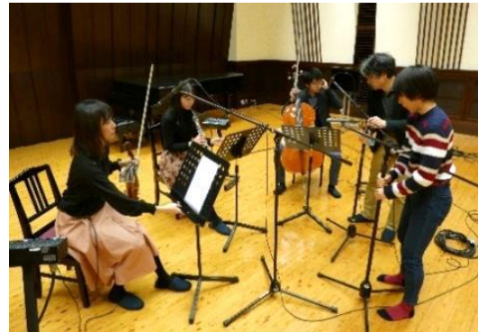
京成上野駅発車メロディー 制作の様子