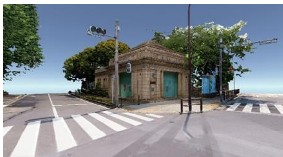
「デジタル ハグドウ駅」の外観