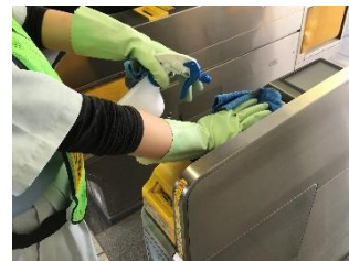
駅構内の消毒作業