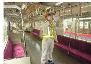
車内の消毒作業 (一般車両)

お客様におかれましても、手洗い・うがい・咳エチケットのほか、時差出勤など混雑時間帯を避けたご乗車や、車内換気のため天候や混雑状況に応じた窓上部の開閉等へのご協力、また、可能な限り、マスクの着用と会話の際の周囲へのご配慮をお願い申し上げます。