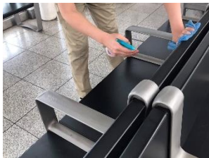
待合室の消毒作業

※職員の熱中症予防のため、お客様と近接しない事を確認したうえでマスクを着用しない場合がございます。