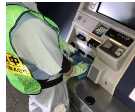
駅構内の消毒作業