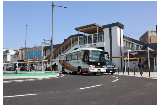
新設される大和西大寺駅

この路線再編では、大阪、京都、橿原方面の交通集約地として奈良県下有数のターミナル駅である大和西大寺駅（奈良県奈良市）の乗り入れを開始します。乗り入れによって、平城京跡、唐招提寺などの観光エリアへのアクセスが向上するほか、首都圏・「東京ディズニーリゾート®」を乗り換えなしで結ぶことで、生駒エリアや京都府南部の利便性向上を図ります。