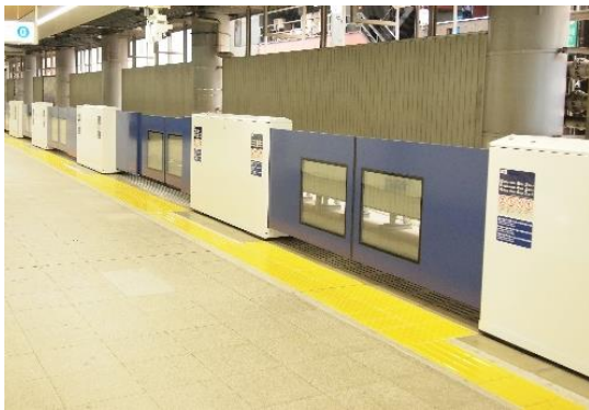
ホームドア(日暮里駅)

当社では駅のバリアフリー化に向けて、これまで国および地方自治体のご協力を頂きながらバリアフリー設備の整備を積極的に実施してまいりました。ホームドアについては、日暮里駅、空港第2ビル駅および成田空港駅へ設置が完了しており、現在、押上駅で工事を進めています。また、全65駅中60駅において段差解消が完了し、内方線付き点状ブロックや運行情報提供設備を全駅に設置しました。