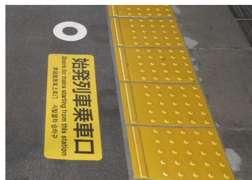
内方線付き点状ブロック