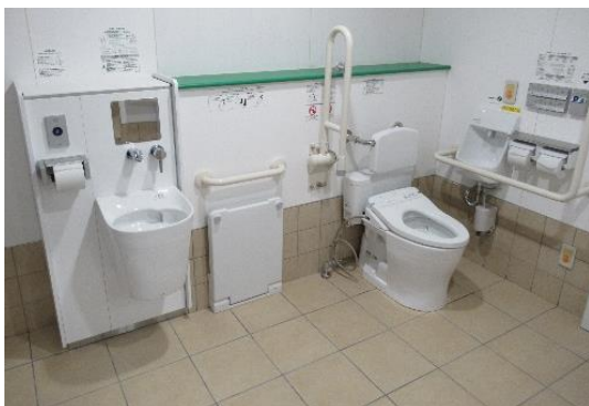
バリアフリースイレ