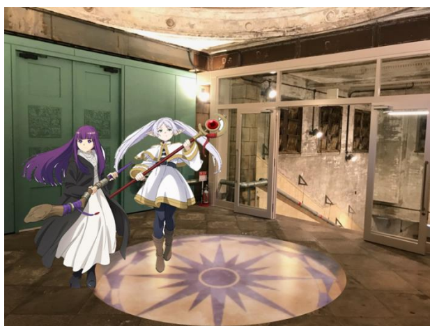
※イベント会場内装(イメージ)