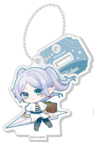
トレーディング ミニキャラアクスタチェーン (イメージ)