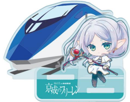
※特製アクリルスタンド B(イメージ)