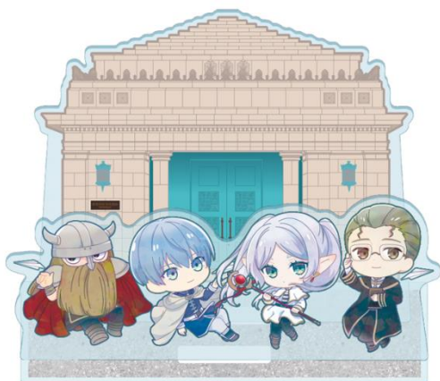
※限定アクリルスタンド(イメージ)

(5) 利用方法 上記 HP にて利用日及び時間を選択しチケットを購入し、当日旧博物館動物園駅前のスタッフ にご提示ください。※完全予約制で、現地でのチケット販売はございません。