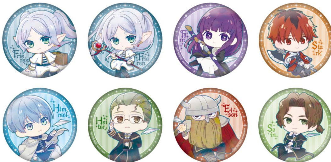
※ランダム缶バッジ全8種(イメージ)