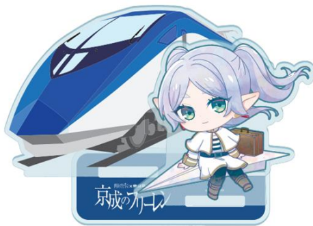
※特製アクリルスタンド A(イメージ)