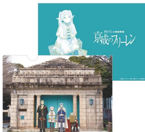
※限定クリアファイル(イメージ)