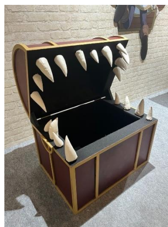
※実物大ミミック(イメージ)