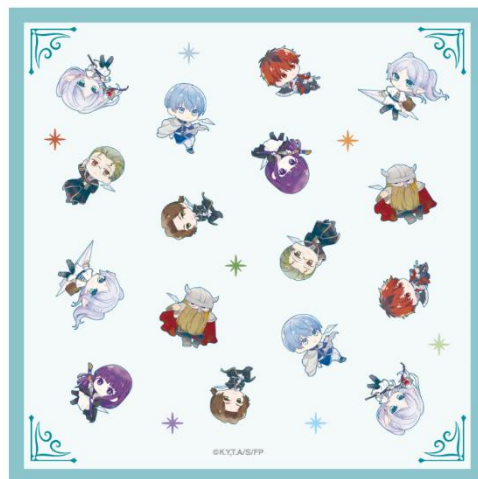
ハンドタオル(イメージ)