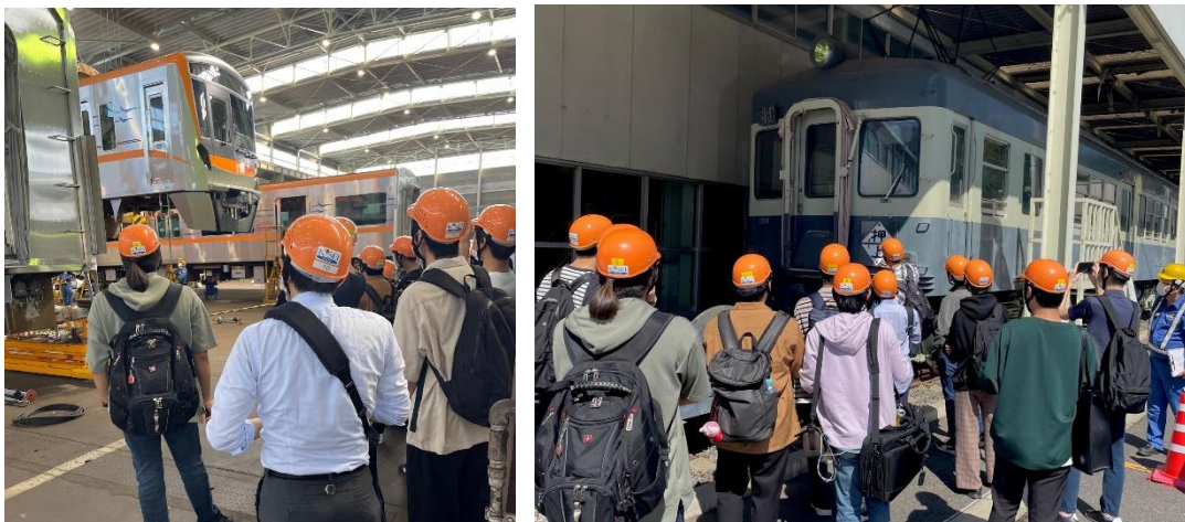
宗吾車両基地見学ツアーの様子