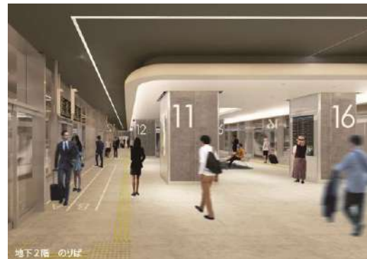
ターミナル内(イメージ)