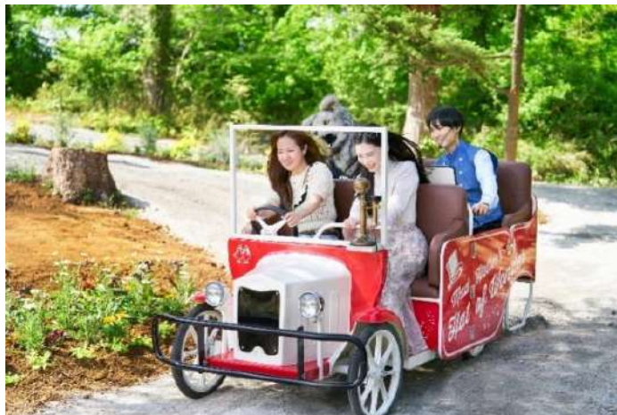
(上)高台の上に浮遊感あふれる「ハートの女王の無重力展望台」が秋限定で初登場 (下)京成バラ園初の自走式ライド系アトラクション「アリスツアーズ」が初の秋装飾で実施