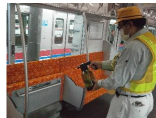
車内の消毒作業 (一般車両)

お客様におかれましても、手洗い・うがい・咳エチケットのほか、時差出勤など混雑時間帯を避けたご乗車や、車内換気のため天候や混雑状況に応じた窓上部の開閉等へのご協力、また、可能な限り、マスクの着用と会話の際の周囲へのご配慮をお願い申し上げます。