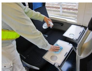
車内の消毒作業 (スカイライナー)