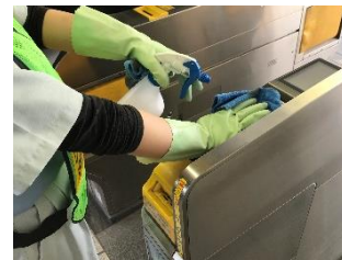
駅構内の消毒作業