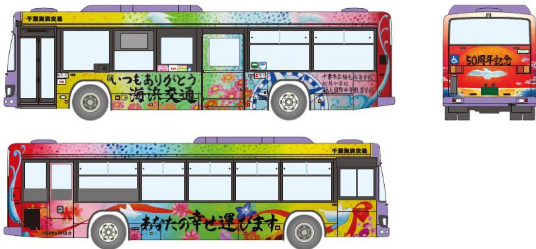
【ラッピングバスデザイン】

千葉海浜交通では、今後もお客様に安全・快適にご利用いただけるよう取り組んでまいります。