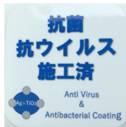
「抗菌・抗ウイルス施工済」ステッカー (鉄道車両内に掲示)