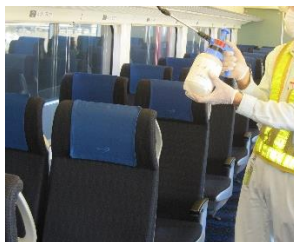
車内の消毒作業 (スカイライナー)