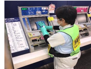
駅構内の消毒作業