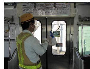
車内の消毒作業 (一般車両)

お客様におかれましても、手洗い・うがい・咳エチケットのほか、時差出勤など混雑時間帯を避けたご乗車や、車内換気のため天候や混雑状況に応じた窓上部の開閉等へのご協力、また、可能な限り、マスクの着用と会話の際の周囲へのご配慮をお願い申し上げます。