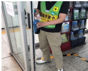
待合室の消毒作業

駅構内および鉄道車両の消毒については、定期に加え必要に応じて実施しています。なお、お客様が手を触れる箇所(券売機、エレベータ内、お手洗い、手すり、つり革、座席等)を中心に、抗菌・抗ウイルス加工を実施しています。一般車両では係員による窓上部の開閉、スカイライナー車両(イブニングライナー・モーニングライナー含む)では換気装置により、車内換気を実施しています。