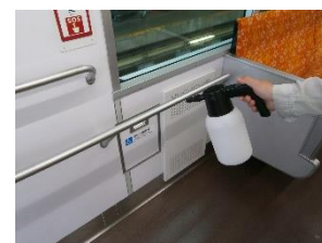
車内の消毒作業 (一般車両)

お客様におかれましても、手洗い・うがい・咳エチケットのほか、時差出勤など混雑時間帯を避けたご乗車や、車内換気のため天候や混雑状況に応じた窓上部の開閉等へのご協力、また、可能な限り、マスクの着用と会話の際の周囲へのご配慮をお願い申し上げます。