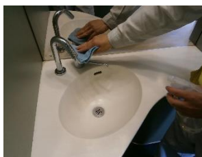
車内の消毒作業 (スカイライナー)