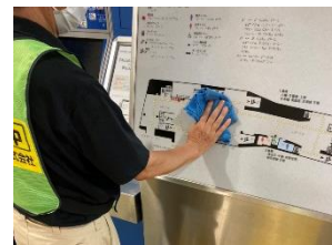
駅構内の消毒作業