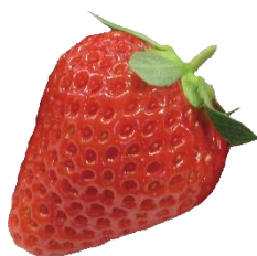
ベリーポップ すず

色も形もいちごらしい優等生。甘みと酸味のバランスが良く、ほっぺが落ちるほどの美味しさです。