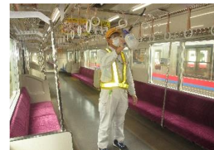
車内の消毒作業 (一般車両)

お客様におかれましても、手洗い・うがい・咳エチケットのほか、時差出勤など混雑時間帯を避けたご乗車や、車内換気のため天候や混雑状況に応じた窓上部の開閉等へのご協力、また、可能な限り、マスクの着用と会話の際の周囲へのご配慮をお願い申し上げます。