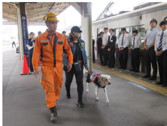
「盲導犬ユーザー等対応講習」の様子