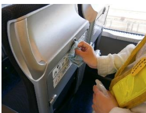
車内の消毒作業 (スカイライナー)