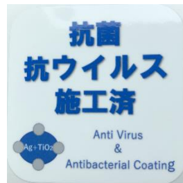
「抗菌・抗ウイルス施工済」ステッカー (鉄道車両内に掲示)