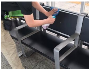
待合室の消毒作業

※職員の熱中症予防のため、お客様と近接しない事を確認したうえでマスクを着用しない場合がございます。