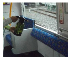
車内の消毒作業 (一般車両)

お客様におかれましても、手洗い・うがい・咳エチケットのほか、時差出勤など混雑時間帯を避けたご乗車や、車内換気のため天候や混雑状況に応じた窓上部の開閉等へのご協力、また、可能な限り、マスクの着用と会話の際の周囲へのご配慮をお願い申し上げます。