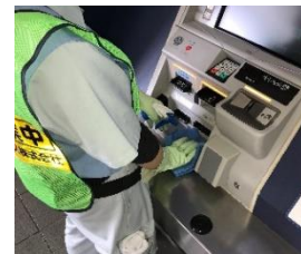
駅構内の消毒作業