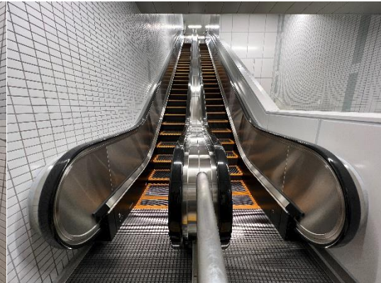
勝田台駅南口エスカレーター