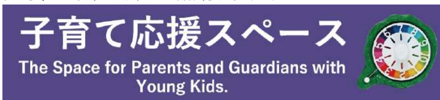
子育て応援スペースのステッカー