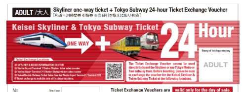
[ใบแลกตั๋ว] Keisei Skyliner & Tokyo Subway Ticket (ภาพประกอบ)