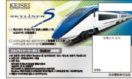
[ใบแลกตั๋ว] “Skyliner Coupon” (ภาพประกอบ)