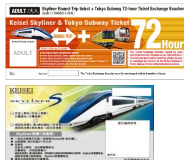
照片左：京成Skyliner，照片右上：Skyliner優惠券(兌換券)示意圖