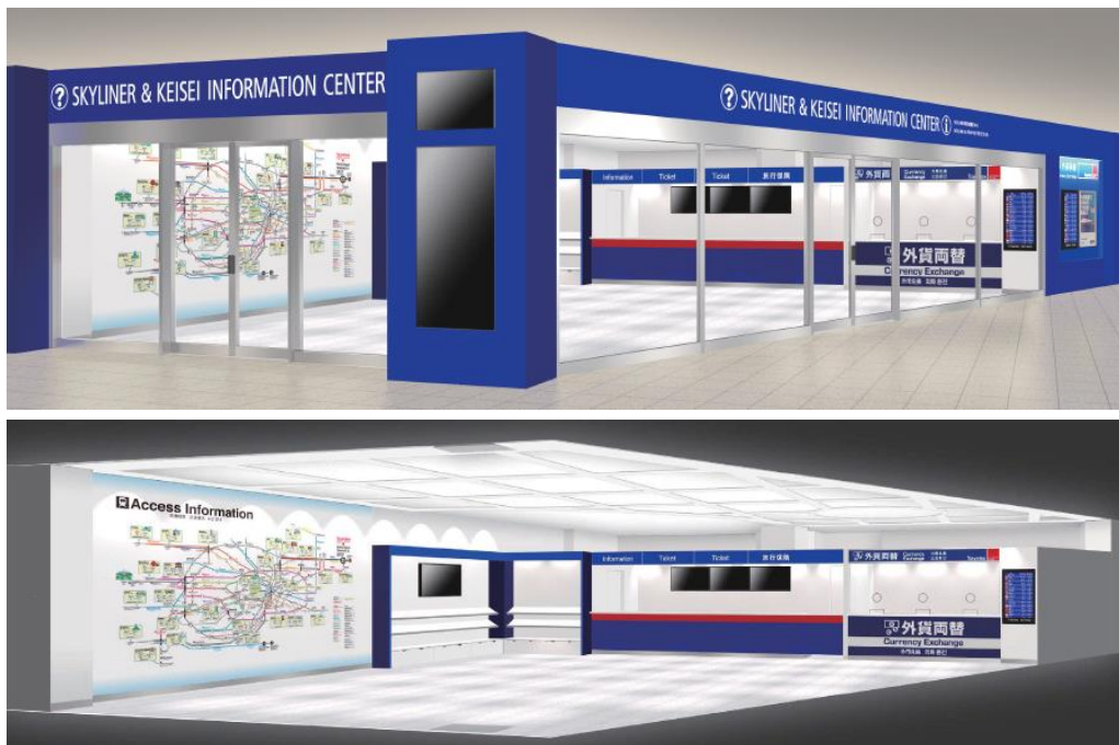
사진(위): 외관 이미지 예상도, 사진(아래): 내관 이미지 예상도