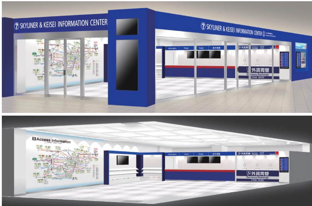
사진(위): 외관 이미지 예상도, 사진(아래): 내관 이미지 예상도

게이세이 전철(본사: 지바현 이치카와시, 사장: 사이구사 노리오)에서는, 나리타공항 제1터미널역 구내의 「다비룸」을 개장하여 12월 1일(목)부터 방일 외국인을 위한 종합 안내카운터 「SKYLINER & KEISEI INFORMATION CENTER」를 오픈합니다.