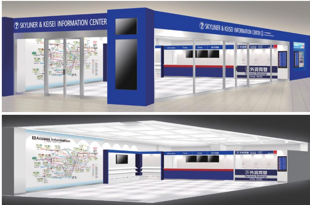
上方照片：外观透视图 下方照片：内观透视图

京成电铁（总部：千叶县市川市，社长：三枝 纪生）对成田机场第1候机楼站站内的“Tabi Room”进行了重新改装，面向访日外国人的综合咨询柜台“SKYLINER & KEISEI INFORMATION CENTER”，将于12月1日（周四）正式开业。