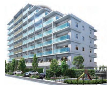
サングランデ津田沼