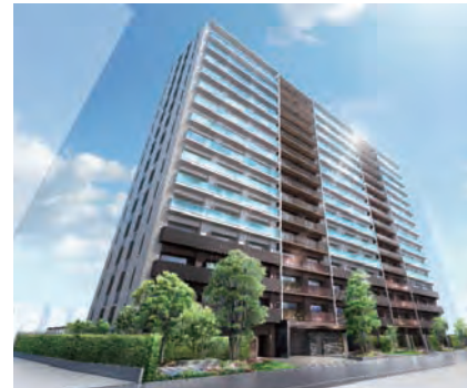
サングランデ サ・レジデンス千葉

その後、平成12年からサングランデシリーズとして事業を展開し、平成29年度末までに2,669戸の販売を行っています。今後も千葉県および東京都区部を中心にマンション事業を展開していきます。