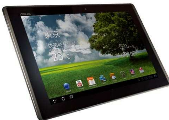
導入するタブレット型端末（イメージ）