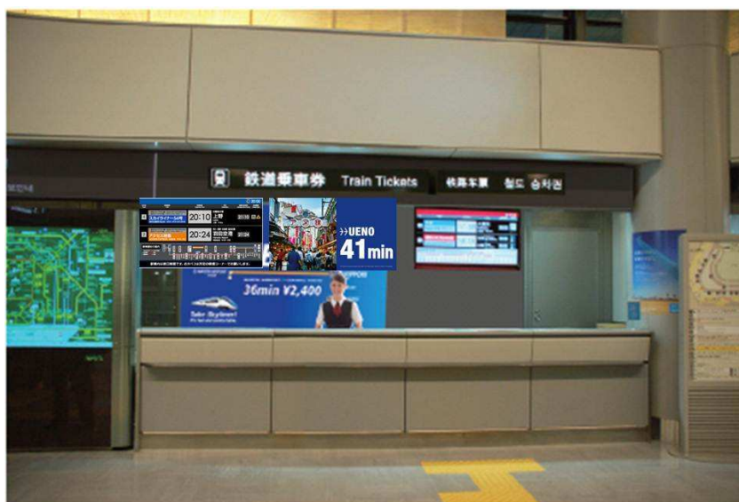
多様な情報が発信されるスカイライナー乗車券販売カウンター（イメージ）

京成電鉄では、平成24年4月1日（日）に、成田国際空港第1旅客ターミナル 南ウイング1階の乗車券販売カウンターをリニューアルオープンします。