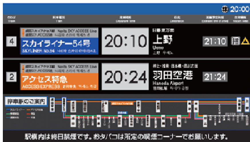
モニター表示内容（イメージ）