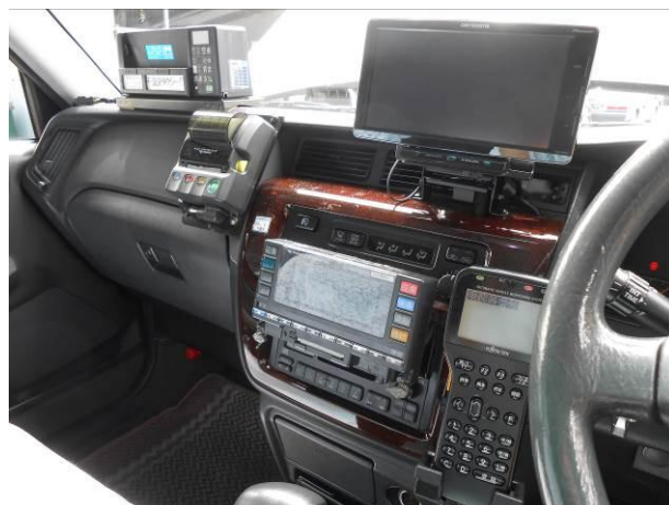
デジタルGPS無線車載器