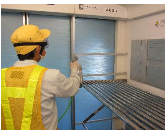
抗菌・抗ウイルス加工作業 (スカイライナー手荷物置き場)