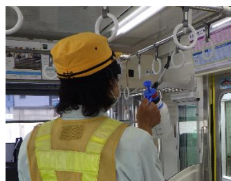
つり革の消毒作業 (通勤車両)