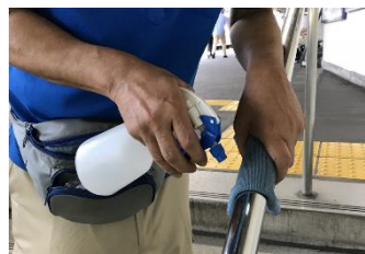
階段手すりの消毒作業