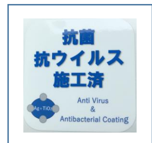
「抗菌・抗ウイルス施工済」ステッカー

お客様におかれましても、手洗い・うがい・咳エチケットのほか、時差出勤など混雑時間帯を避けたご乗車や、車内換気のため天候や混雑状況に応じた窓上部の開閉等へのご協力、また、可能な限り、マスクの着用と会話の際の周囲へのご配慮をお願い申し上げます。