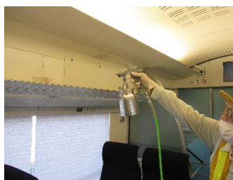
抗菌・抗ウイルス加工作業 (スカイライナー網棚)