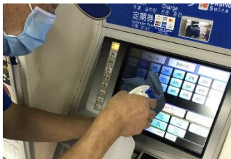
自動券売機の消毒作業

※熱中症予防のため、お客様と近接しない事を確認したうえでマスクを着用しない場合がございます。