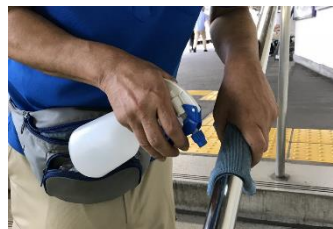
階段手すりの消毒作業