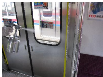
乗降口手摺りの消毒作業 (通勤車両)