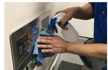
エレベータボタンの消毒作業