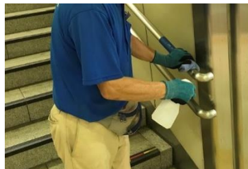
階段手すりの消毒作業