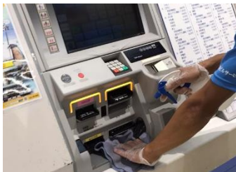
自動券売機の消毒作業

※熱中症予防のため、お客様と近接しない事を確認したうえでマスクを着用しない場合がございます。