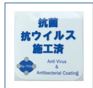
「抗菌・抗ウイルス施工済」ステッカー

お客様におかれましても、手洗い・うがい・咳エチケットのほか、時差出勤など混雑時間帯を避けたご乗車や、車内換気のため天候や混雑状況に応じた窓上部の開閉等へのご協力、また、可能な限り、マスクの着用と会話の際の周囲へのご配慮をお願い申し上げます。