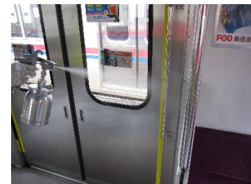
乗降口手摺りの消毒作業 (通勤車両)