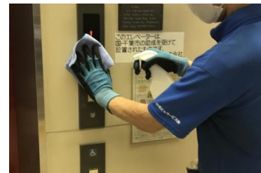
エレベーターボタンの消毒作業