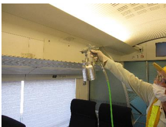
抗菌・抗ウイルス加工作業 (スカイライナー網棚)