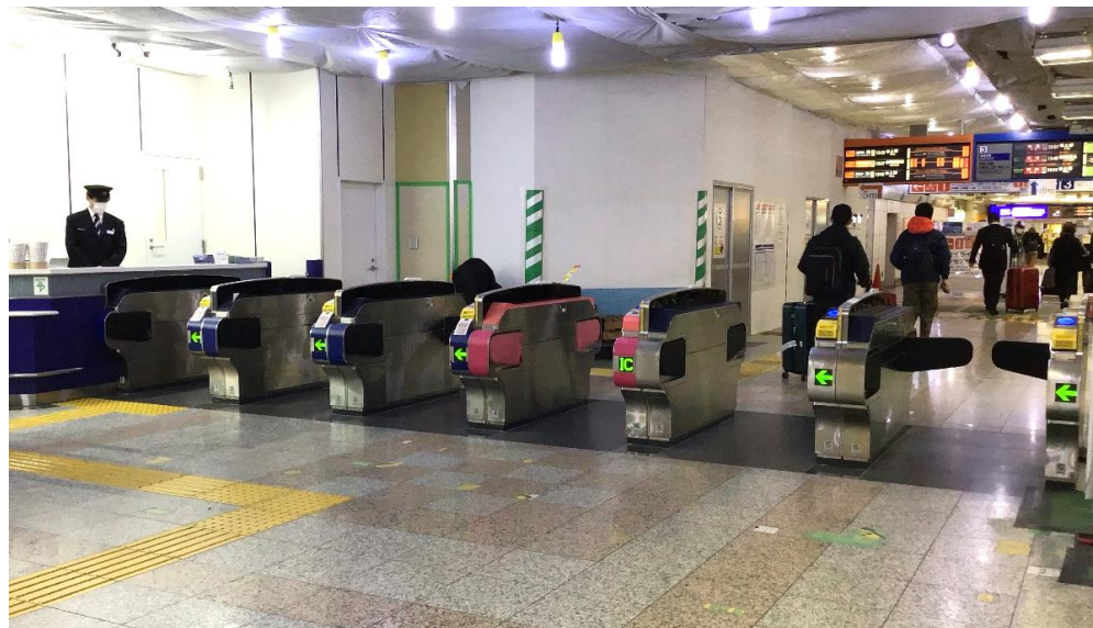
空港第2ビル駅 入口改札