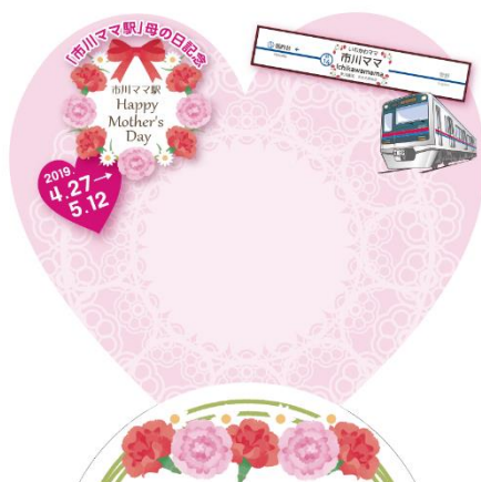
フォトスポットデザイン(イメージ)