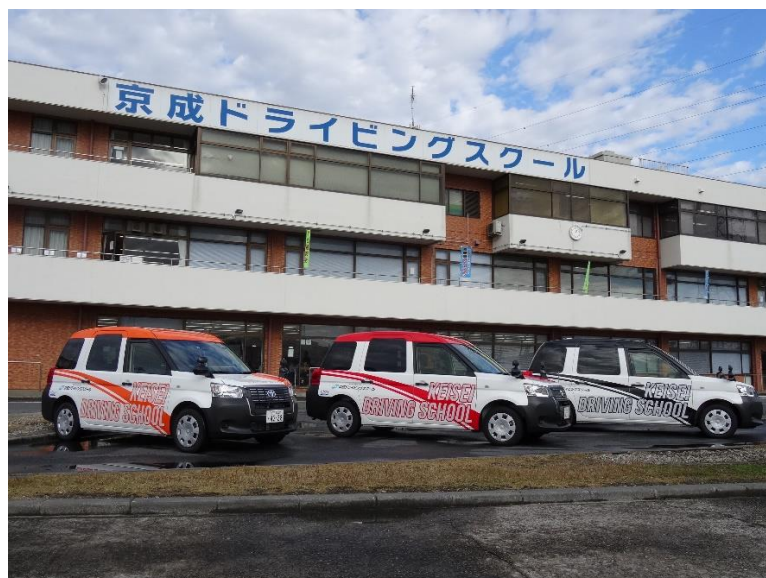
「ジャパントクシー教習車」の外装

このトヨタ「ジャパントクシー」を使用した教習車を導入し、免許取得時(普通二種免許)の技能教習に用いることで、新人タクシードライバーが「ジャパントクシー」の運転経験を積んだ状態で営業運転を行うことができ、事故の減少に寄与することが期待されます。