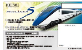
スカイライナークーポン【引換券】(イメージ)