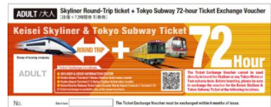
Keisei Skyliner & Tokyo Subway Ticket 【引換券】(イメージ)

JTB Pte Ltd Travelsaloon Takashimaya S.C.店 (シンガポール)