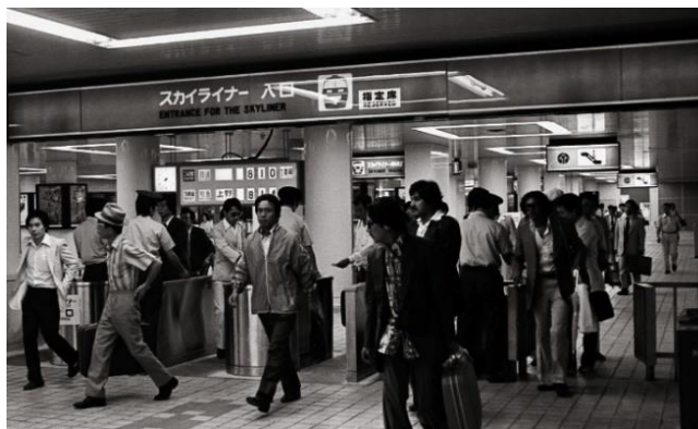
東成田(旧成田空港)駅開業時の様子