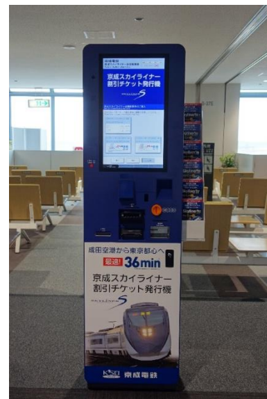
京成スカイライナー 割引チケット発行機