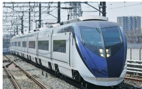
京成スカイライナー