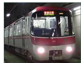
都内の観光スポットを巡る東京の地下鉄ネットワーク （写真は東京メトロ銀座線・東京都交通局大江戸線）