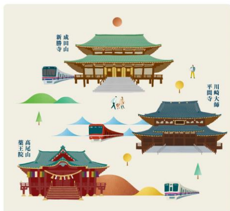
ポスター（イメージ）