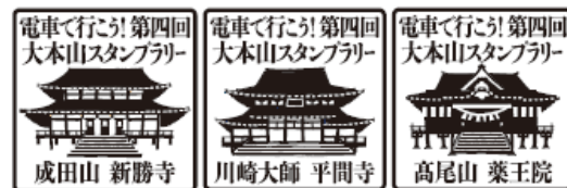
寺院スタンプ（イメージ）