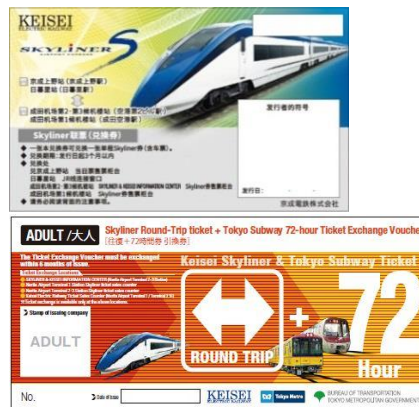
写真左：スカイライナー、写真右上：スカイライナークーポン(引換券)イメージ 写真右下：Keisei Skyliner & Tokyo Subway Ticket(引換券)イメージ