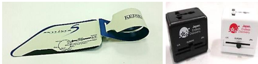
画像左：京成電鉄オリジナルラゲッジタグ(イメージ)