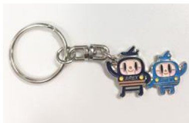
画像：空港鉄道オリジナルキーホルダー(イメージ)