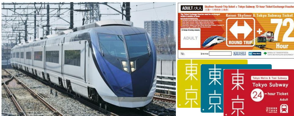
写真左：スカイライナー、写真右上：Keisei Skyliner & Tokyo Subway Ticket(引換券)イメージ 写真右下：Tokyo Subway Ticketイメージ

「Keisei Skyliner & Tokyo Subway Ticket」の販売箇所拡大についての詳細は次頁のとおりです。