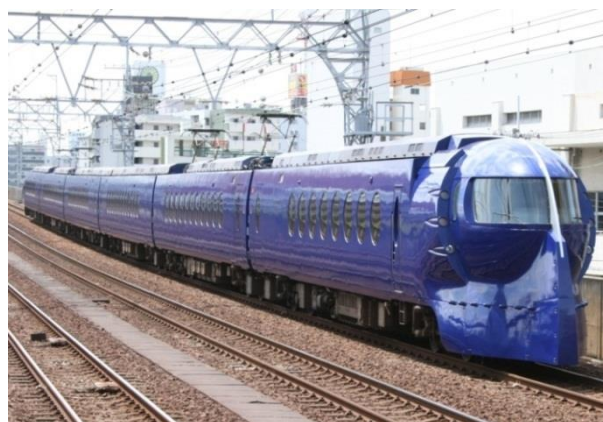
南海電鉄が運行するラピート

「成田・関西 スカイライナー&ラピートきっぷ」は、2015年12月より発売している企画乗車券で、上野～成田空港を結ぶ「京成スカイライナー」の片道特急券・乗車券と、難波～関西空港を結ぶ「南海ラピート」の片道特急券・乗車券を組み合わせたセット企画乗車券で、通常金額よりも700円お得にご購入いただけるものです。