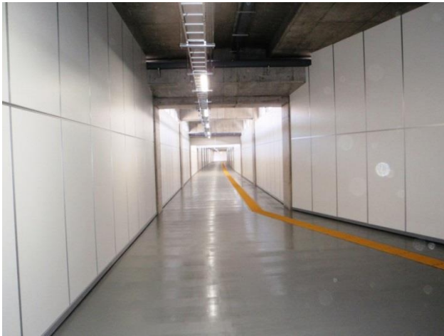
新たに供用開始となる中層階通路

京成曳舟駅と明治通りの間の高架橋の中層階に歩行者用の通路を設置し、明治通り付近に連立事業で設置した墨田区が管理する昇降施設に接続いたします。