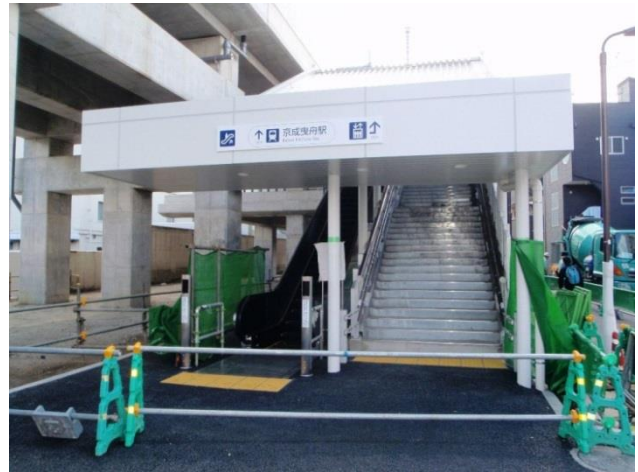
墨田区が管理する昇降施設