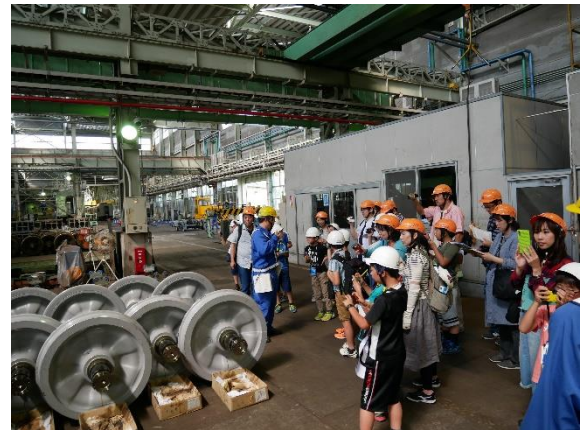
宗吾車両基地で熱心に取材する様子