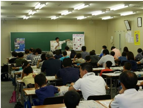
記者による出前授業の様子